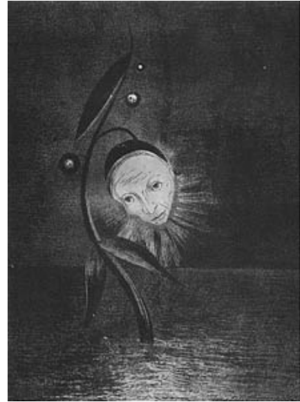
La fleur du marécage

Dans ce qu'il appelait ses « peintures noires », les fusains, le peintre joue sur les nuances de la couleur même dans la gamme du noir et blanc et réussit à exprimer un monde magique où règnent la peur des forces mystérieuses et à créer d'étranges visions ; le fusain ne permet pas d'être plaisant, il est grave, même dramatique si l'on pense aux visages à l'expression triste, inquiétants dans la mesure où ils se trouvent dans des cadres bizarres. Les paysages « lunaires » de Redon, qui servent de modèle implicite au décor du cauchemar de des Esseintes (des souvenirs de fièvre typhoïde), décrits dans À Rebours ou bien dans En Rade où la peinture des paysages suggèrent aussi bien des tableaux de Moreau ou de Redon :