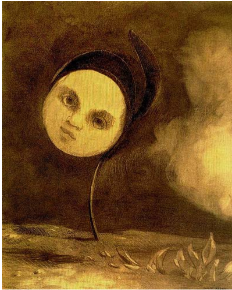
Fleur à tête d'enfant