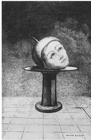
Sur la coupe